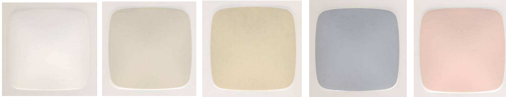
ホワイト オフホワイト アイボリー ブルーグレー ピンク