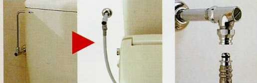
従来の給水管方式 フレキ給水方式 クイックジョイント

タンク横の給水管がなく、タンク下からのフレキ給水でタンクまわりの見栄えもスッキリ。拭き掃除もラクにできます。また、クイックジョイント方式の採用で、簡単・確実な接続が可能です。作業の手間を省き、現場でスピーディに施工できます。